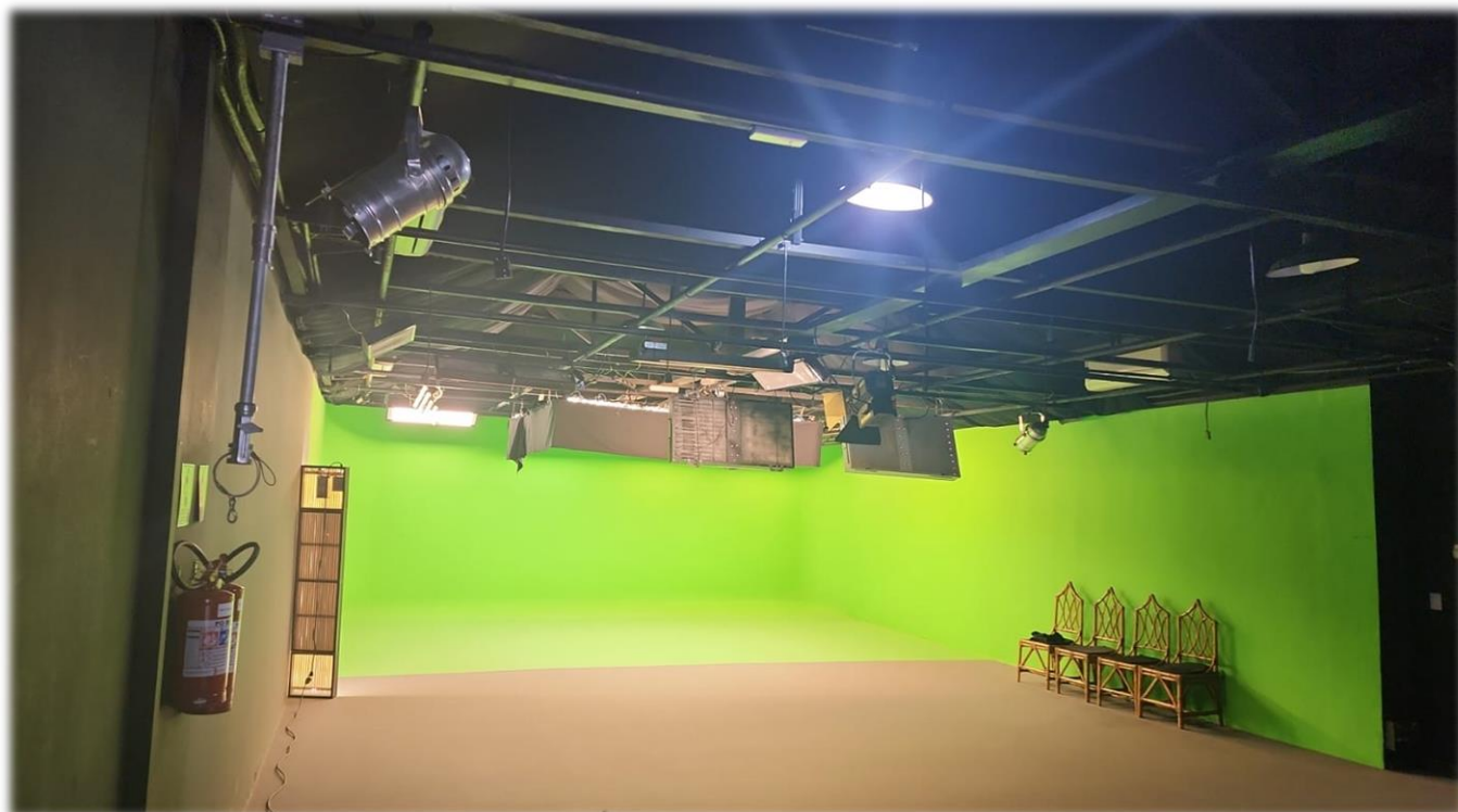
Estúdio semi-blimpado, com fundo infinito, gride de luz e ar-condicionado. Metragem: 114 m 2 (7,8 x 10,20 mts). Pé direito de 3 metros. Sala de produção (com ar-condicionado).