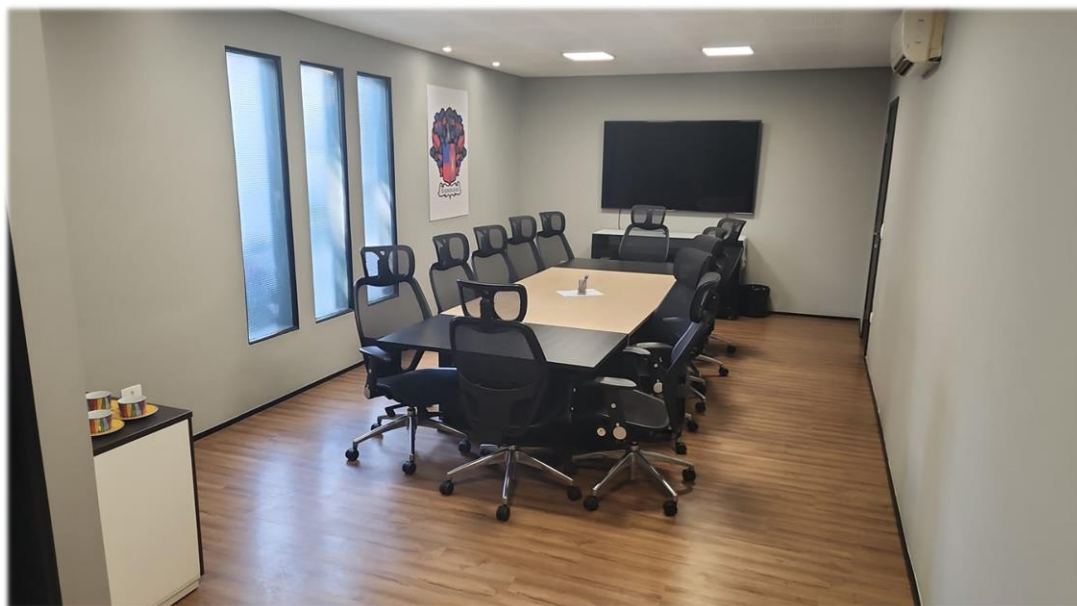
Mesa de reunião para 12 pessoas com toda estrutura, com TV de 70 polegadas e banheiro.