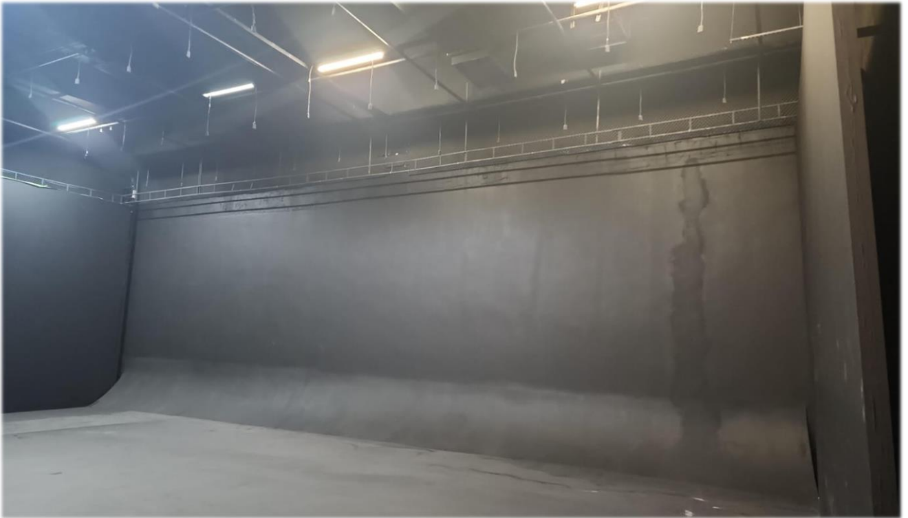
Estúdio Fundo infinito, gride de luz e ar-condicionado central.